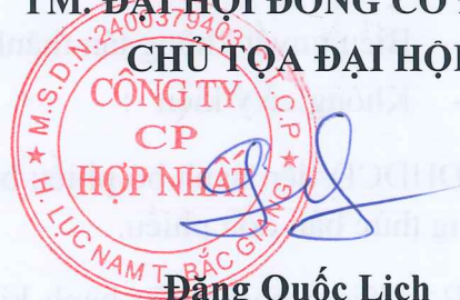
Đặng Quốc Lịch